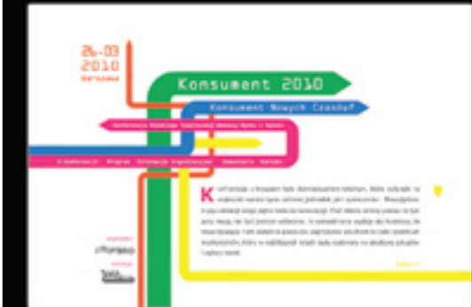
Konferencja Konsument 2010

Katalog dystrybuowany jest między innymi podczas eventów organizowanych przez PTBRiO: