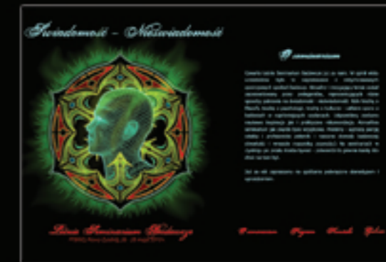
Letnie Seminarium Badawcze