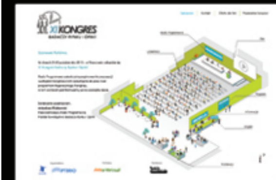
Ogólnopolski Kongres Badaczy Rynku i Opinii